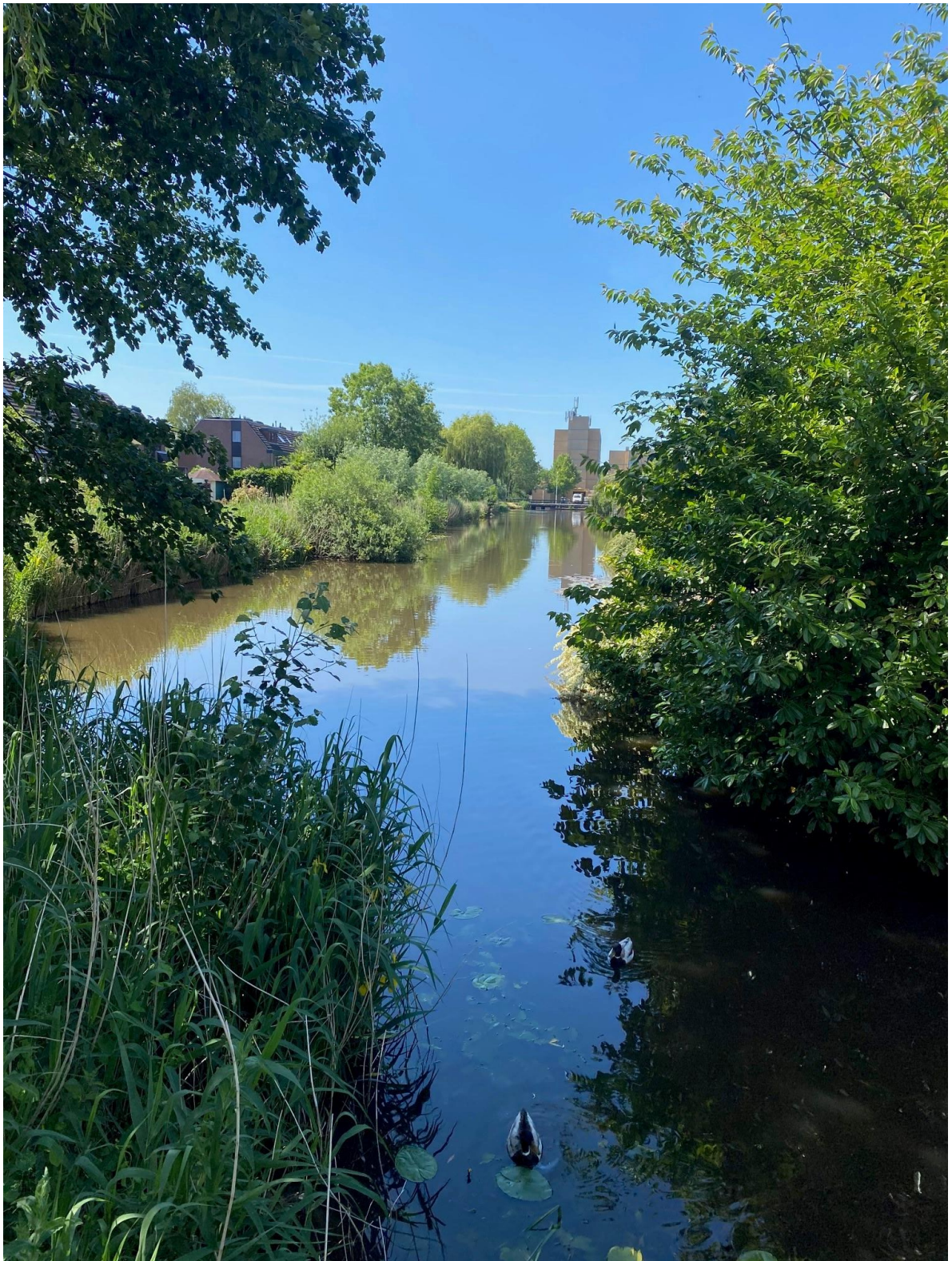
De Sluisvaart in Ouderkerk a/d Amstel anno 2020