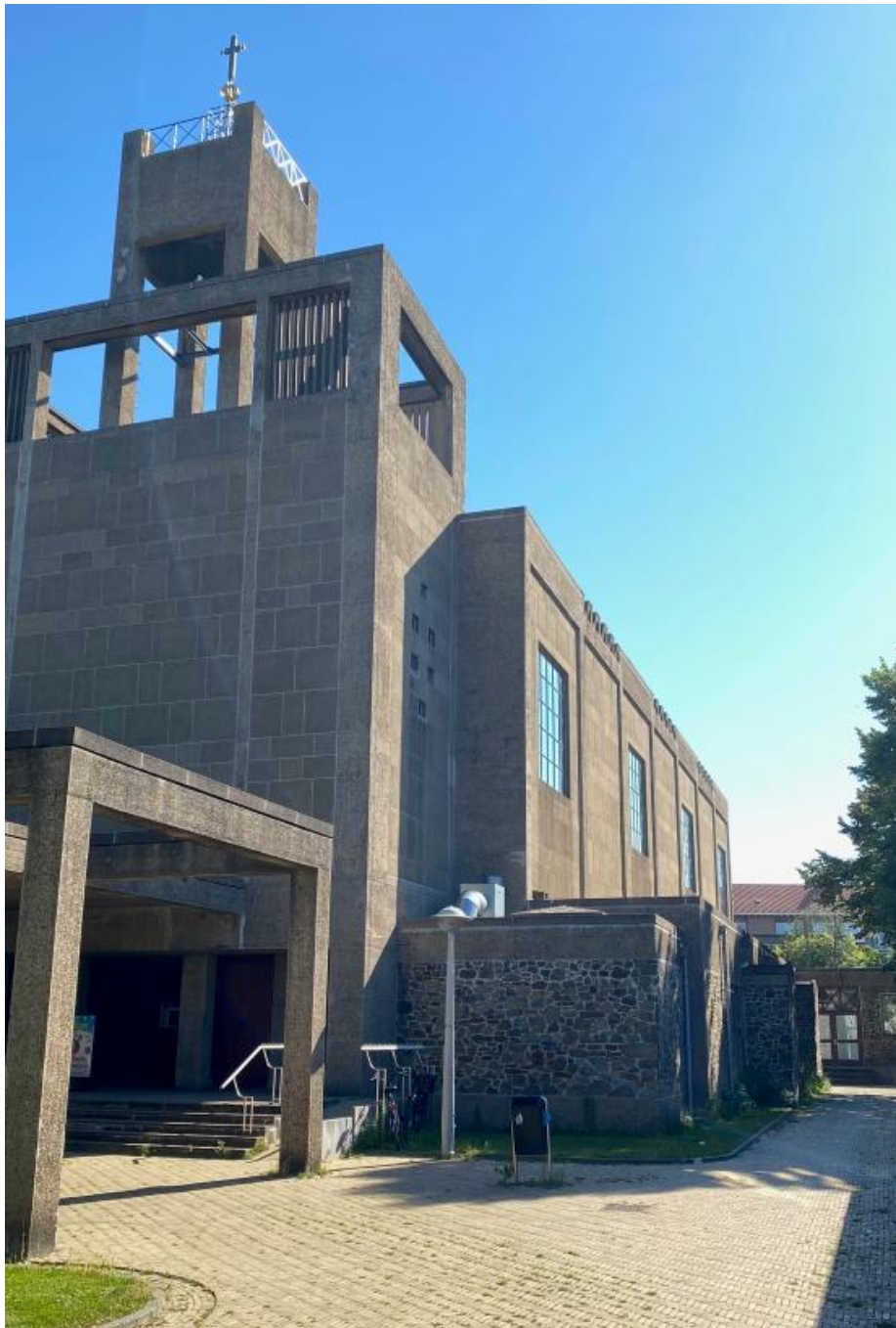
St Jozeph-parochie, kerk thans in gebruik als speelparadijs (2020). Het kerkgebouw heeft wel de status Monument.