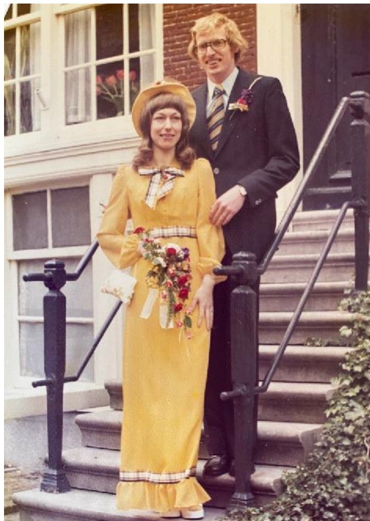
Het huwelijk werd op 8 mei 1973 in de kerk op het Begijnhof in Amsterdam gesloten. Anno 2023 zijn ze al 50 jaar getrouwd.