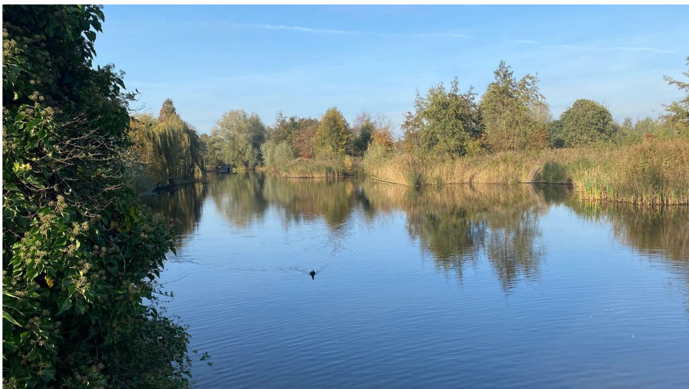
Het Nelson Mandelapark naast Huntum in Amsterdam Zuidoost