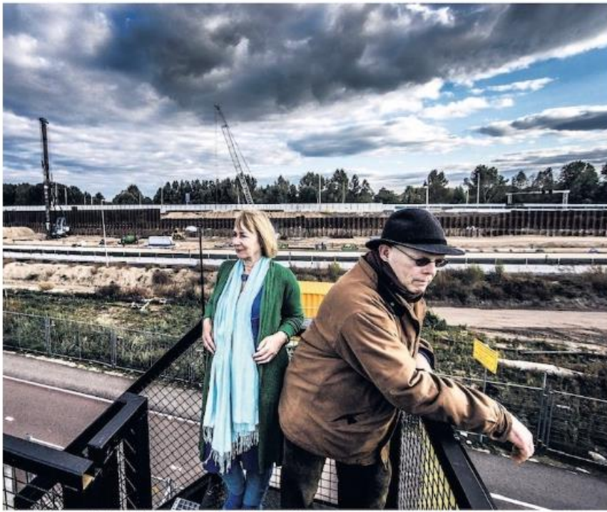
bewonerscomité op het uitkijkpunt over de werkzaamheden aan de A8.

trichiteit viel uit nadat bedrading was losgetrokken, en deze zomer stonden vijf portopwagens naast haar woning dag en nacht te pompen om een ondergrondse lekkage tegen te gaan. "Rijkswaterstaat was niet aanspreekbaar. Het lek was buiten het bouwterrein."