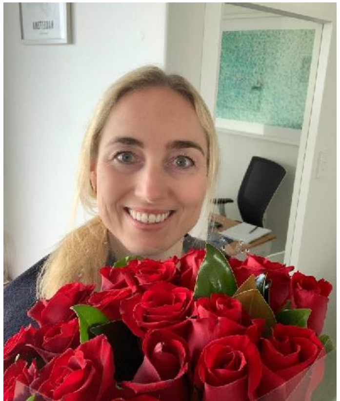
Anno 2020, na de lockdown i.v.m. de Covidcrisis, gaat het goed met de familieleden in Amsterdam, Oegstgeest en Sydney